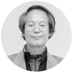
出口代表 (自治会長)

「支え合い安心して暮らせる為の見守り」を目的とした住民主体の活動団体です。「地域福祉座談会の見守り会議」として、東員町地域支えあい活動団体になりました。昨今ますます少子高齢化が進み、住み慣れた地域で幸せに過ごし続けるにはどうしたら良いかという思いから活動中。日々過ごされる時に、ひとつの生きがいの手助けとして行いたいと考えて活動を継続中です。みなさんと一緒になって「見守り会議」を活発に行いましょう。お気軽に声をかけてください。