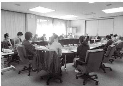
令和4年10月26日(水) 理事会