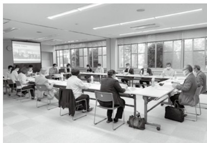
令和4年6月8日(水) 理事会