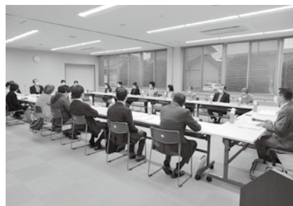
令和5年3月23日(木) 評議員会

理事会は東員町にお住まいの方ひとりひとりが幸せを感じて暮らし続けられるために一層効率的効果的にできるような業務執行を決定します。