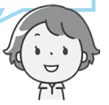
主任ケア マネージャー