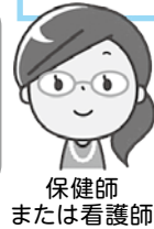
保健師 または看護師