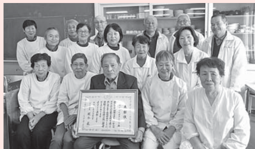
わくわくボランティア