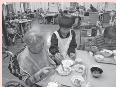
お食事の補助をしました