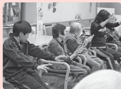
一緒に体操しました