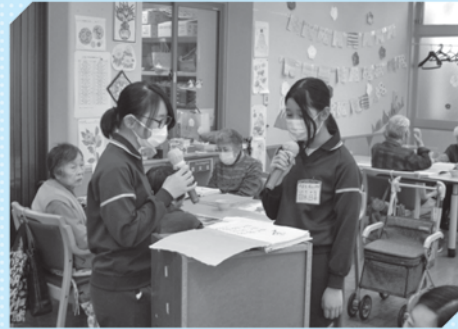
城山小学校職業体験 春の歌を一緒に歌っています