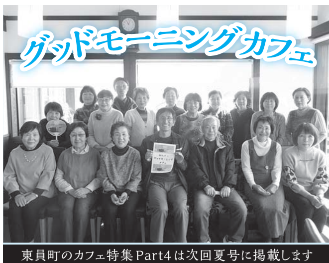
東員町のカフェ特集 Part4は次回夏号に掲載します

平成30年3月17日(土)、くろがねもーちにて町内各地区でカフェ活動に携わっている方の交流会、「グッドモーニングカフェ」を開催し、各カフェから21名の方にご参加いただきました。