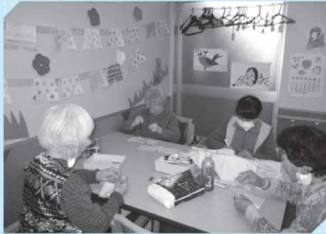
稲部小学校職業体験 パッチワーク制作

利用者も可愛い生徒さんが来てくれて喜んでいました。この職場体験を通して、福祉の仕事に関心を持って頂けたら幸いです。