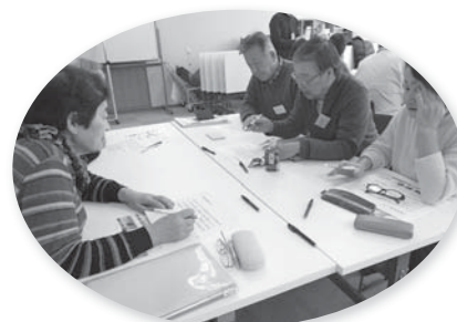
グループワークの様子です