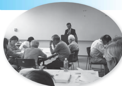
講義を受けています