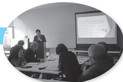
成年後見について学びました