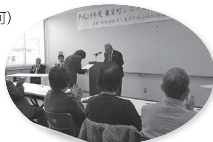
卒業証書を受け取りました