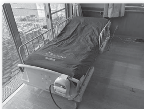
贈呈されたエアーマット