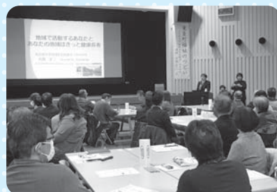
福祉のつどいの開催