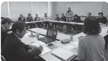
地域福祉推進協議会