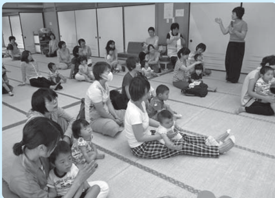
子育て応援ルームイベントの様子

毎週月曜日と水曜日に子育てをしている親さんとその子どもさんが自由に遊べる場を設けています。ぜひ遊びにきてください。